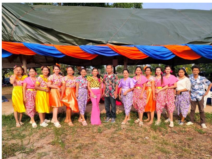
กิจกรรมประเพณีบุญบั้งไฟ