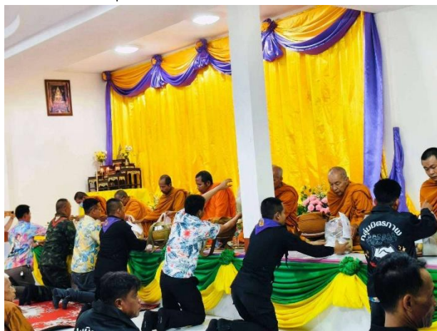
กิจกรรมทำบุญตักบาตร

อบต.ภูผาหมอก ส่งเสริมให้พนักงาน/เจ้าหน้าที่ เข้าร่วมกิจกรรมวันสำคัญต่าง ๆ ทำบุญตักบาตร เข้าวัด ฟังธรรม ทั้งที่จัดขึ้นเองและร่วมกับหน่วยงานอื่นอย่างสม่ำเสมอ เพื่อส่งเสริมและรักษาขนบธรรมเนียมประเพณีท้องถิ่นให้คงอยู่ ส่งเสริมคุณธรรม จริยธรรมให้กับบุคลากร เสริมสร้างความสามัคคีของบุคลากรในหน่วยงานและส่งเสริมการมีส่วนร่วมกับชุมชนและหน่วยงานอื่น