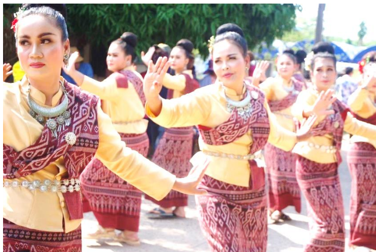
กิจกรรมประเพณีวันสงกรานต์